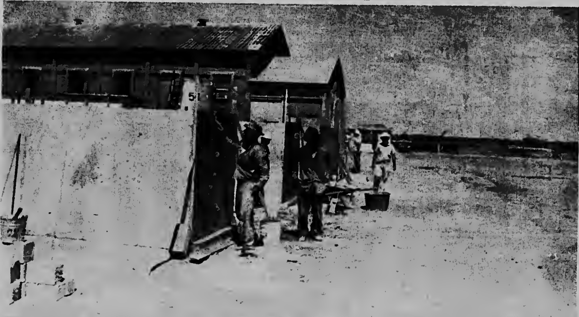
Un bista riba e localidad riba terreno di Eagle, den cual e obreronan cu werkverschaffing ta hanja les di mesla y carpinte.

ORANJESTAD--Diajueves mainta miembronan di Eilandsraad, diputadonan y miembronan di prensa a sali pa bishita locual antes tabata "Tabuleerdienst" y tambe e instituto caminda trahadornan di werkverschaffing ta hanja les den diferente ofishinan.